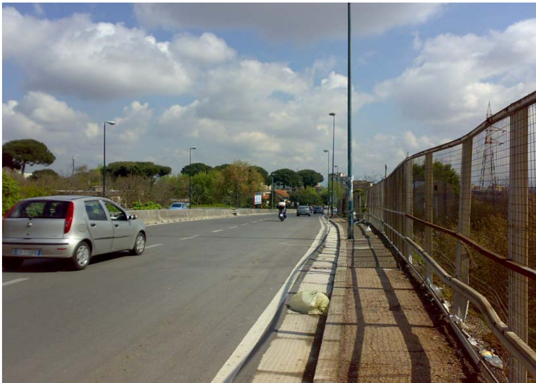
Via dei Ciliegi, il tratto sul ponte