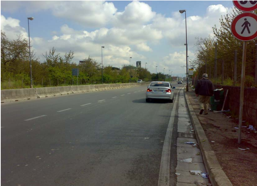
Via dei Ciliegi, da via Toscanella